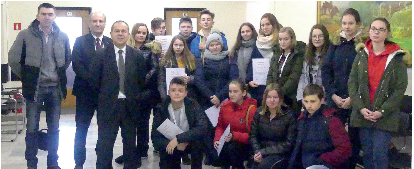
● Uczniowie Gminnego Zespołu Szkół w Łagowie na spotkaniu w Banku PEKAO SA w Opatowie

W pierwszym tygodniu ferii uczniowie ze szkół spędzili czas na realizacji ogólnopolskiego projektu „Ferie z ekonomią”.