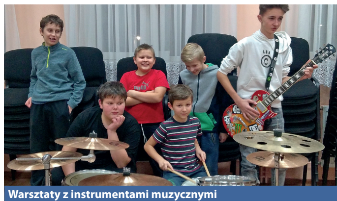
Warsztaty z instrumentami muzycznymi

wiskowej. Takie wspólne gry jak bingo, monopole, scrabble czy też rebusy, łamigłówki zawsze uczą organizacji, pracy w zespole, motywują do działania, a przy czym świetnie bawią dzieci. Równie ciekawie i zaskakująco dzieci spędziły czas podczas warsztatów kulinarnych „Jemy kolorowo - żyjemy zdrowo”.