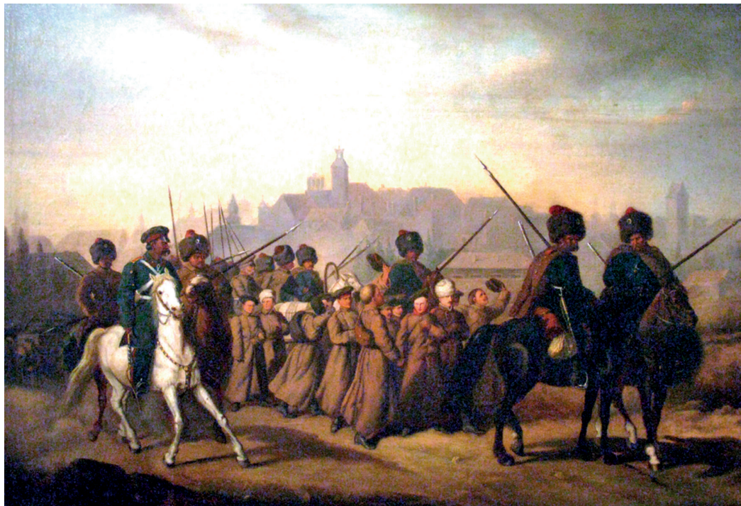
● Branka - pobór do wojska rosyjskiego w 1863 r.

Powstanie zintegrowało społeczeństwo polskie, gdyż walczyli w nim przedstawiciele wszystkich warstw społecznych. Bardzo aktywnie zaangażowały się kobiety, które jeszcze w okresie przedpowstańczym tworzyły tzw. „piątki” – tajne stowarzyszenia. Ich celem było organizowanie pogrzebów dla ofiar poległych podczas manifestacji patriotycznych oraz zbiórka pieniędzy dla ich rodzin, poszukiwanie mieszkań dla ukrywających się działaczy niepodległościowych, wyrabianie im fałszywych dokumentów, organizowanie wyjazdów w bezpieczne miejsca itp. Kobiety płaciły na ten cel charytatywne składki.