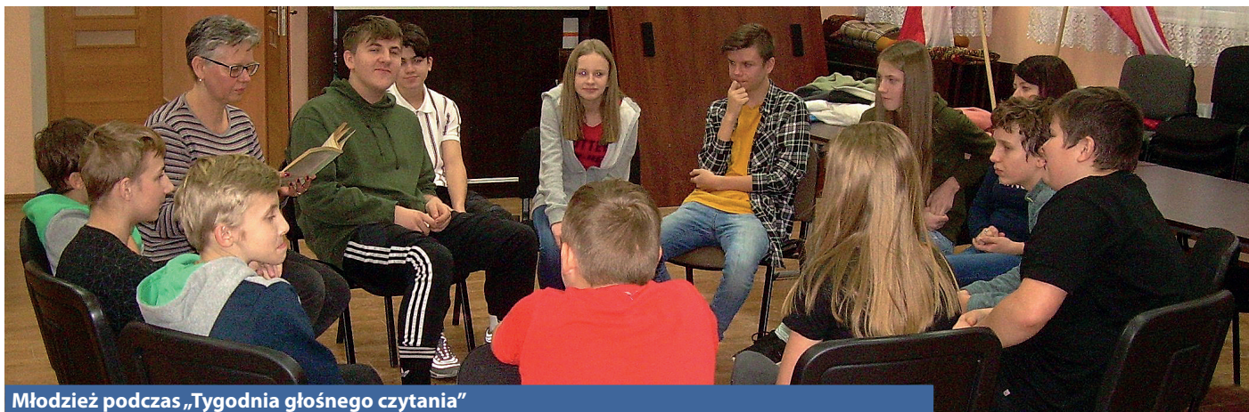
Młodzież podczas „Tygodnia głośnego czytania”