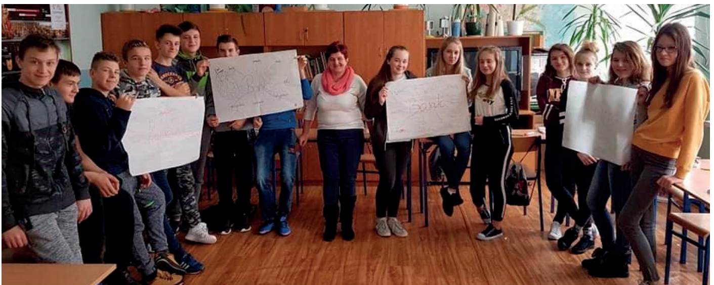
● Uczniowie Szkoły Podstawowej w Starej Zbelutce podczas zajęć w ramach projektu „Ferie z ekonomią”